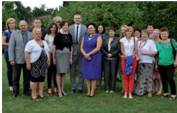
Po wręczeniu nagród wspólne zdjęcie wraz z koleżankami i zaproszonymi gośćmi