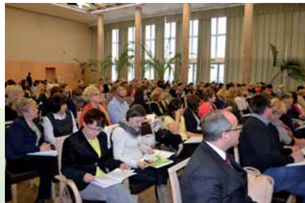
Uczestnicy konferencji

Na konferencji przedstawiono zagadnienia związane z przysposobieniem dzieci, podkreślające wielowymiarowość adopcji. Zwrócono uwagę na prawny aspekt adopcji, w tym na procedury związane z pozostawieniem noworodka w szpitalu, adopcję ze wskazaniem czy przysposobienie międzynarodowe dziecka. Istotą konferencji było poszerzenie oraz utrwalenie przez specjalistów wiedzy o aspekty adopcji, które nie dotyczą ich w sposób bezpośredni, ale w efekcie sprawiają, że procedury są przeprowadzane sprawnie, z uwzględnieniem przede wszystkim dobra dzieci kwalifikowanych do przysposobienia oraz rodzin adopcyjnych. Uczestnikami konferencji byli przedstawiciele instytucji wspierania rodziny i systemu pieczy zastępczej, sądów rejonowych, zespołów kuratorskiej służby sądowej oraz ośrodków pomocy społecznej.