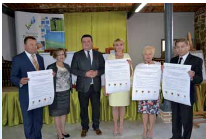
Przedstawiciele samorządów województw zachodniopomorskiego, lubuskiego, pomorskiego oraz warmińsko-mazurskiego