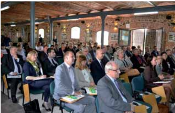
Uczestnicy konferencji

30 czerwca i 1 lipca 2014 r. w Pałacu Siemczyno (województwo zachodniopomorskie) została zorganizowana konferencja w partnerstwie z samorządami województw: zachodniopomorskiego, lubuskiego, pomorskiego oraz warmińsko-mazurskiego pn. „ Rewitalizacja środowisk popegeerowskich – odzyskanie uśpionego kapitału ”, nad którą patronat honorowy objęła Para Prezydencka .