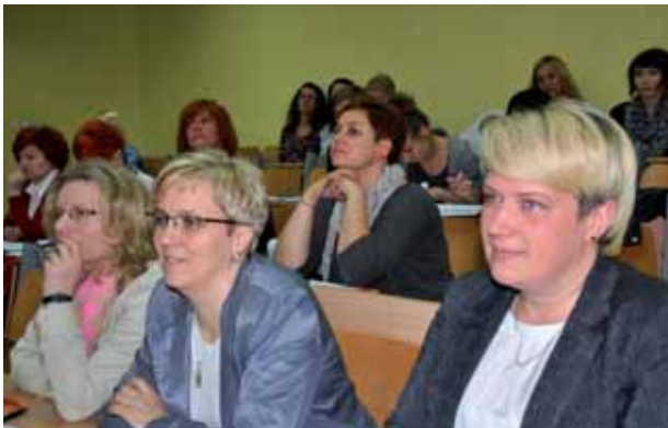
Słuchacze podczas wykładów