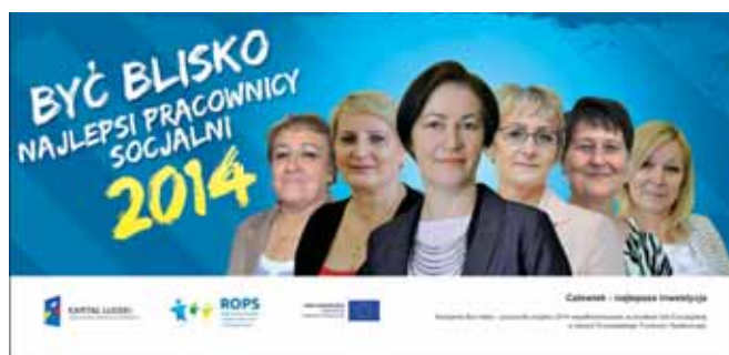
Finalistki konkursu „Być blisko”

W wyniku konkursu „Być blisko” wpłynęło aż 169 formularzy konkursowych, w których to podopieczni korzystający z pomocy społecznej opisywali swoje historie związane ze wsparciem, jakie otrzymali od wyróżnionych przez siebie pracowników socjalnych.