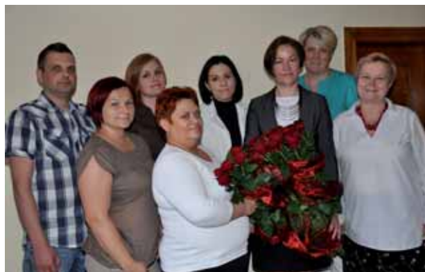
Zespół Ośrodka Pomocy Społecznej w Trzcielu